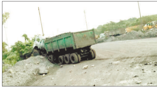
दुर्घटनाग्रस्त ट्रैलर वाहन।