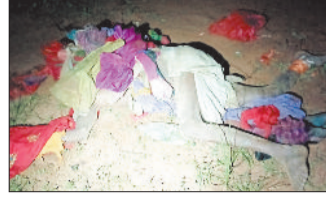
मृतक का शव।

हाथियों की जानकारी एवं ग्रामीणों को सूचना दिया गया है। उक्त मृत व्यक्ति के बारे में ग्राम कोटवार एवं संपर्क रामपुर ग्रामवासियों को लगातार दिया जा रहा है एवं विद्युत विभाग को भी लगातार हाथी की उपस्थिति की जानकारी दिया जा रहा है। वन विभाग के द्वारा रात्रि गस्त कर