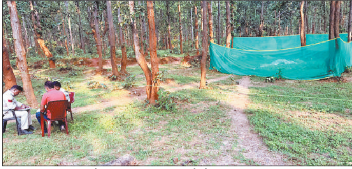
घटनास्थल पर जांच करती पुलिस और वन विभाग की टीम।

जिले में हाथियों का आतंक थमने का नाम नहीं ले रहा है। कोरबा वनमंडल के करतला रेंज में हाथियों के झुंड ने एक विक्षिप्त अर्धेड व्यक्ति को पटक पटक कर मौत के घाट उतार दिया है। घटना की सूचना पर वन विभाग व पुलिस की टीम मौके पर पहुंची थी। जहां पुलिस ने मामले में वैधानिक कार्रवाई की है। समाचार लिखे जाने तक मृतक की पहचान नहीं हो पाई है। पुलिस द्वारा मामले में जांच की जा रही है।